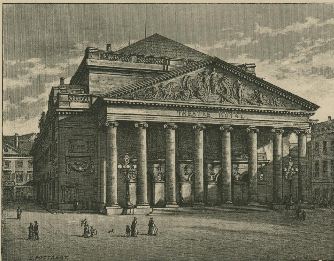
LE THÉÂTRE DE LA MONNAIE APRÈS SA RECONSTRUCTION PAR POELAERT (1856). Dessin original de E. Puttaert.

Voici ce qu'un critique disait d'elle en 1836 : « Il est très rare de rencontrer une aussi belle qualité de voix que la sienne, mais elle n'en tire qu'un médiocre parti. Il lui faudrait des études conduites par un maître habile pour faire disparaître de